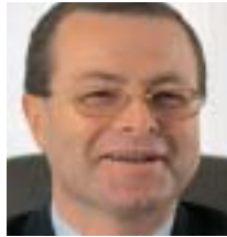
Pjeta: „Die Einrichtung der Akademie war goldrichtig“

Entlastung. Somit sei es der Ärztekammer nunmehr möglich, sich auf die unmittelbaren Aufgaben zu konzentrieren im Wissen, dass die Fortbildung von einem spezialisierten Team nach den standespolitischen Vorgaben bestmöglich betreut wird. „Gerade der Umstand, dass die lebenslange Fortbildung der Ärzte sowie ihre Spezialisierung in Teilbereichen von steigender Bedeutung ist, wird die akademie weiterhin herausfordern“, so Pjeta. „Ich bin der festen Überzeugung, dass gerade unter